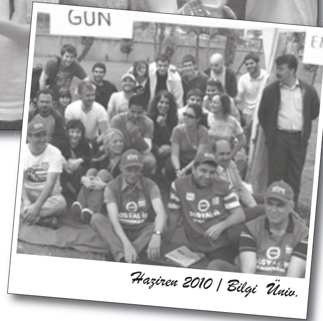
Haziran 2010 | Bilgi Üni.

Sarı, AKP hükümetinin de bu katliamın ortağı olduğu vurgu yaptı. İsrail devletinin Ortadoğu'da barışa engel olduğunun bir kez daha görüldüğünü söyleyen Sarı açıklamasını şu sözlerle sonlandırdı: "İsrail devletine karşı yürütülecek bu mücadele Yahudi yurttaşlara yönelik bir tepkiye dönüştürülmemelidir. İnsanlığa karşı açılan bu savaşa insanlığın temel değerlerini savunarak karşı durabiliriz. Filistin halkına