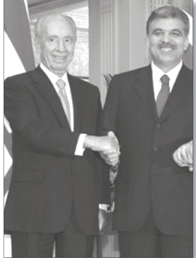
Başbakanı Binyamin Netanyahu ile bir araya gelecekti.

Washington'un derin katlarından haber sızdırma becerisiyle tanınan Aslı Aydıntaşbaş'ın, ifşa ettiği anlaşmaya göre tablo şöyle: "Baskının ertesinde, Washington'da çok özel ve son dakikaya kadar gizli tutulan bir toplantı planlanmaktaydı. 1 Haziran Salı günü Başbakan Erdoğan'ın gezisinden ayrılarak Arjantin'den ABD'ye uçuşması beklenen Dışişleri Bakanı Ahmet Davutoğlu, Washington'da ABD Başkanı Hillary Clinton, ardından da Kanada'dan gelecek olan İsrail